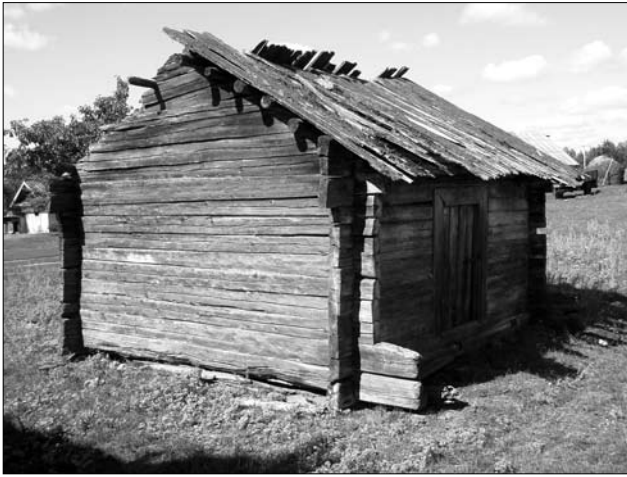
Кліть кін. XIX ст. у с. Березове Рокитнянського р-ну Рівненської обл.