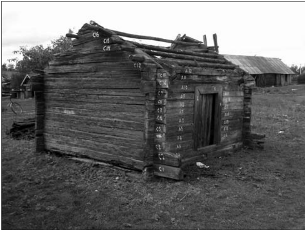
Кліть кін. XIX ст. у с. Березове Рокитнянського р-ну Рівненської обл. (у процесі демонтажу)

між ними була незначною — вона дорівнювала приблизно довжині виносу причілкового піддашшя (1,17 м: с. Мотійки; 1,2 м: с. Рокитно; 1,4 м: с. Крута Слобода; 1,8 м: с. Березове). За твердженням поліщуків, це робили, як звичайно, з теплотехнічних міркувань, щоб захистити дверний отвір від задування вітру, засікання дощу, снігу. Подекуди (сс. Крута Слобода, Березове) з тильного боку між «стебкою» і «кліттю» споруджували стінку («загороду»). Траплялось, що стінку робили і спереду, внаслідок чого утворювалась тридільна споруда «стебка» + «прикоморник» («прикоморок») + «кліть», яку в Олевському р-ні (Жит.) називали «збожжя». Вхід у «прикоморок» прорубували із чільного фаса-