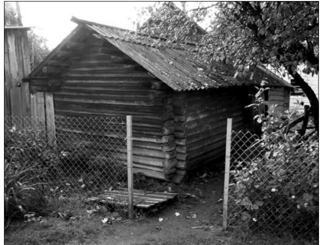
Кліть др. пол. ХІХ ст. у с. Березове Рокитнянського р-ну Рівненської обл.

У ХІХ — на поч. ХХ ст. поліська «кліть» була невеликою (3—4 х 3—4 м) 5 підквадратною чи децю