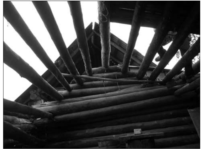
Кліть сер. XIX ст. у с. Залав'я Рокитнянського р-ну Рівненської обл. (у процесі демонтажу)