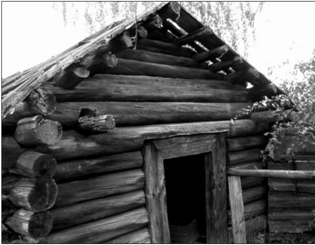
Кліть сер. XIX ст. у с. Залав'я Рокитнянського р-ну Рівненської обл.

тому вінці, внаслідок чого «муст» піднятий над поверхнею ґрунту на 85 см.