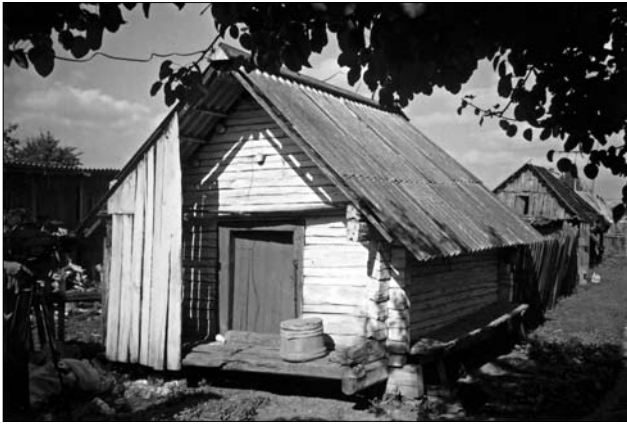
Кліть др. пол. XIX ст. у с. Дроздів Рокитнянського р-ну Рівненської обл.

розділеними конструкціями покриття і «накотом» перекриття: у них присутнє склепінчате перекриття («через сомець»), а над ним дах на «дідках» (півсохах) чи «козлах» [16, с. 20; 19, с. 197]. Вкривали дахи «клітей» деревом, соломою, а зрідка й очеретом [19, с. 197; 30, с. 44]. Дерев'яне покриття «тесом» переважно зустрічалося на Східному і Центральному Поліссі Білорусії [19, с. 197] та на Середньому Поліссі України (Рів., Жит., Київ.).