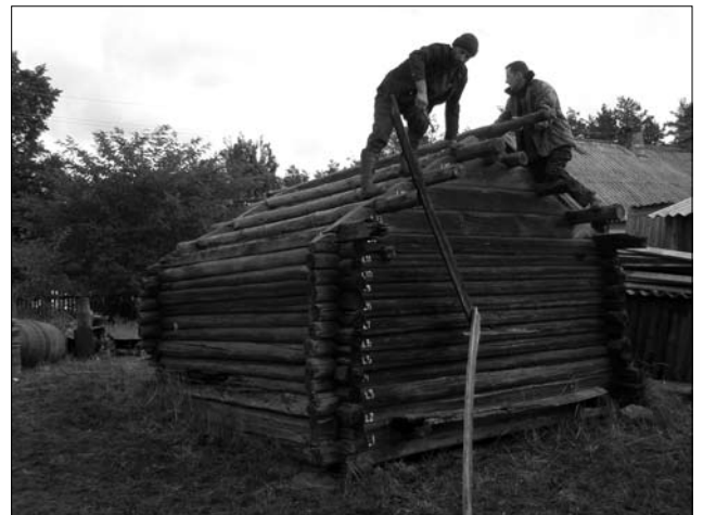
Кліть сер. XIX ст. у с. Рудня Карпилівська Сарненського р-ну Рівненської обл. (у процесі демонтажу)

с. 97; 8, с. 25—32, 56—57; 11, с. 45; 15, с. 174; 25, с. 87—98; 28, с. 20]. Широко побутували вони на теренах Полісся Білорусії [30, с. 26, 28], а також на Брянсько-Жиздринському Поліссі (колишні Суражський, Мглинський повіти Чернігівської губернії) [14, с. 78; 26, с. 148]. Стосовно Західного Полісся України та Білорусії, а також Підляшшя, — тут вже у другій пол. XIX ст. таке перекриття невідоме: кліті (місцева назва «шпіхерик») зазвичай мали окрему плоску стелю з дощок або плах та окремий дах на кроквах. Проте дані мовознавства та археології дають усі підстави стверджувати, що давніше дах «накотом» побутував і у цих місцевостях [4, с. 39; 18, с. 20; 22, с. 197]. У центральній частині Полісся Білорусії (подібно як і у південно-східних районах Центральної Білорусії та південних районах Подніпров'я) широко побутували кліті з