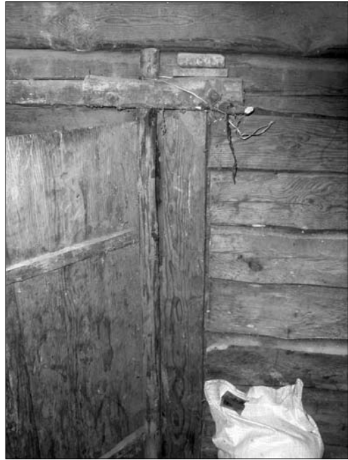
Двері «на бiгунах» у клітi др. пол. XIX ст. у с. Карпилiвка Сарненського р-ну Рiвненської обл.