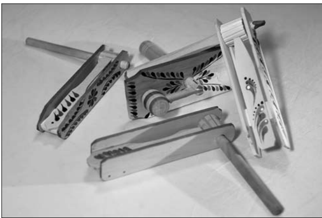
Рахкала і калатало — майстер Оксана Когут, Остап Сойка