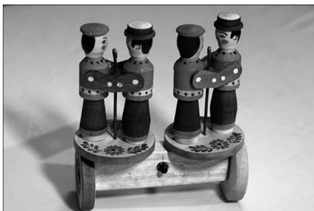
Гультяї — майстер Оксана Когут, Остап Сойка