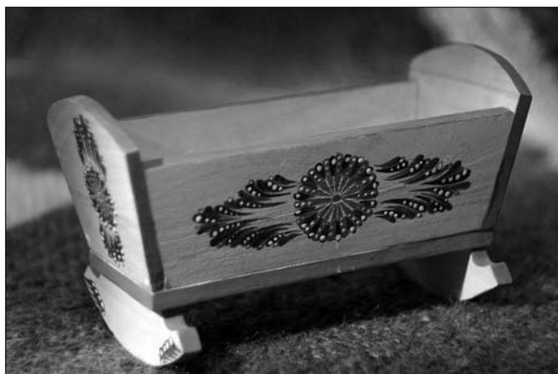
Колисочка — виготовили учні ПТУ м. Івано-Франкове Яворівського р-ну Львівської обл.