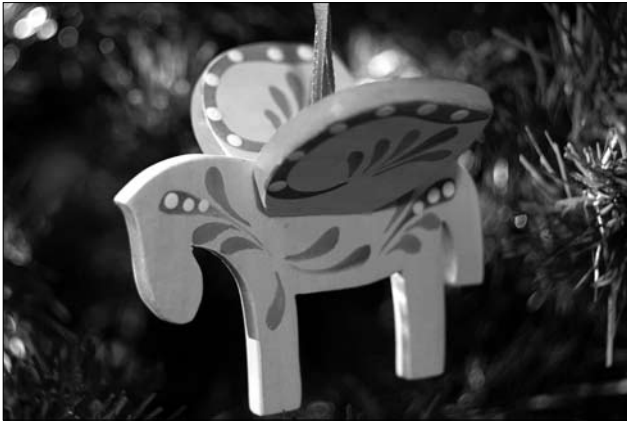
Коник — майстер Оксана Когут, Остап Сойка