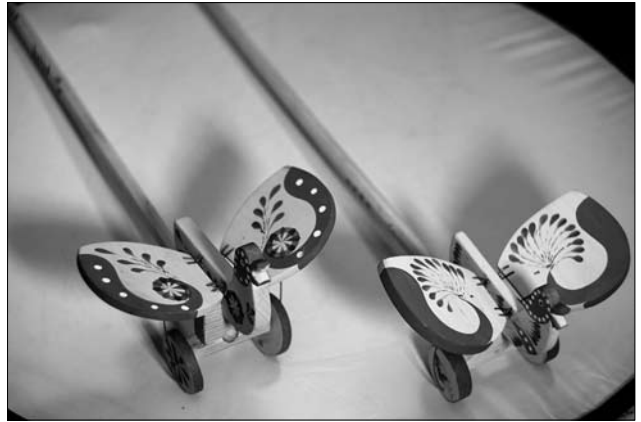
Пташка — майстер Оксана Когут, Остап Сойка