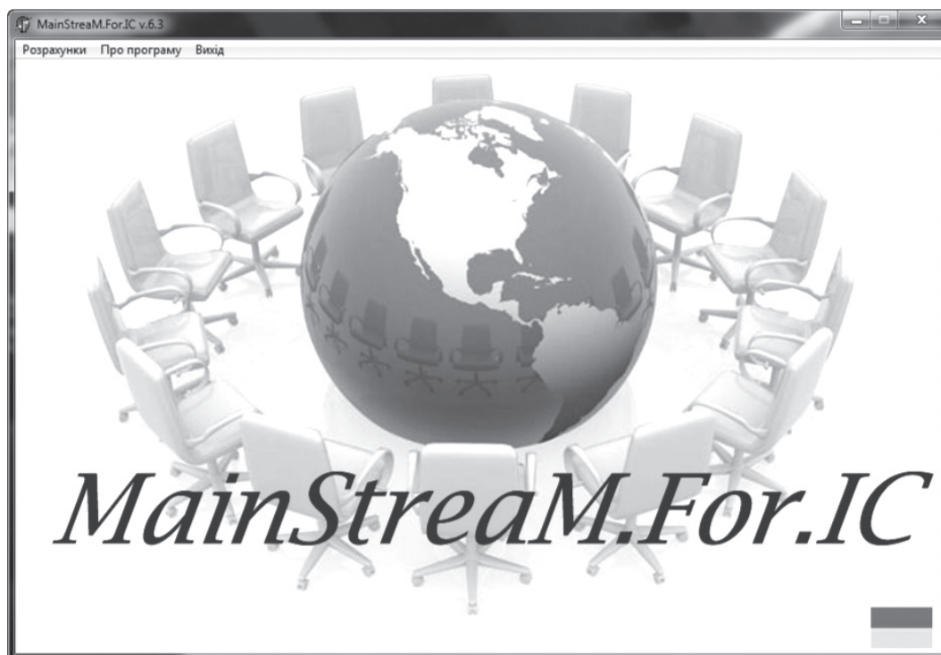
Рис. 1. Головне операційне вікно цільової комп'ютерної програми MainStream.For.IC v.6.3

Це, у свою чергу, дозволило забезпечити реалізацію різних підходів при формуванні методології макроекономічного регулювання процесів забезпечення ефективності використання інтелектуального капіталу та розробці цільового програмного продукту MainStream.For.IC v.6.3 (рис. 1), що є спробою використання прикладного інструментарію для провадження об'єктивних процедур по оцінюванню-прогнозуванню параметричних змін основних компонент інтелектуального капіталу і розробки стратегії його формування в контексті модернізації національного господарства. [4]