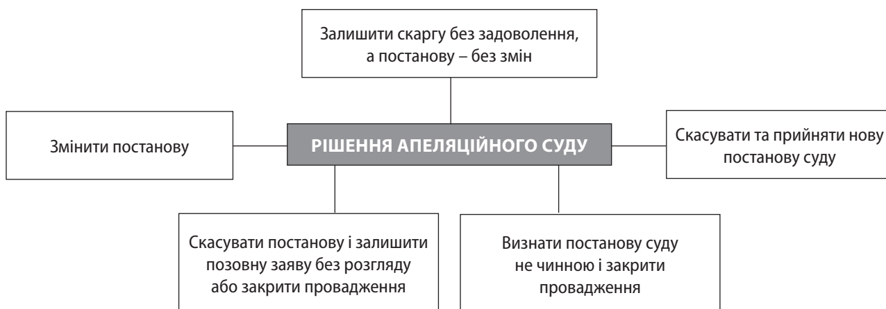
Рис. 2. Рішення апеляційного суду за наслідками розгляду справи про визнання протиправним та скасування ППР

частково) в касаційному порядку рішення суду першої інстанції після їх перегляду в апеляційному порядку, а також рішення суду апеляційної інстанції. Підставами касаційного оскарження є порушення судом норм матеріального чи процесуального права. Касаційна скарга подається у письмовій формі безпосередньо до касаційного суду, протягом 20 днів після набрання законної сили рішенням суду апеляційної інстанції. Вимоги до касаційної скарги узагальнено у табл. 1.