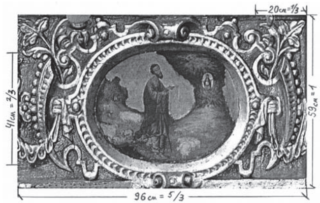
Обміри та пропорційний лад декоративного картуша «Неопалима купина» з додаткового ярусу іконостаса Успенської церкви у Львові (I пол. XVII ст.)

На жаль, не маємо повністю збереженої конструкції українського іконостаса з XVI ст. Проте