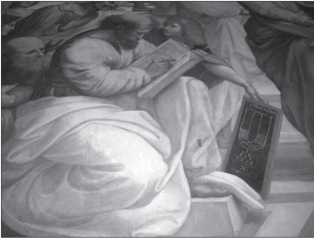
Рафаель. Фреска «Афінська школа» в станцах папи Юлія II Ватиканського палацу (1508—1511 рр.)

середньовічний принцип, базований на системі узгодження подібних фігур (квадратів!).