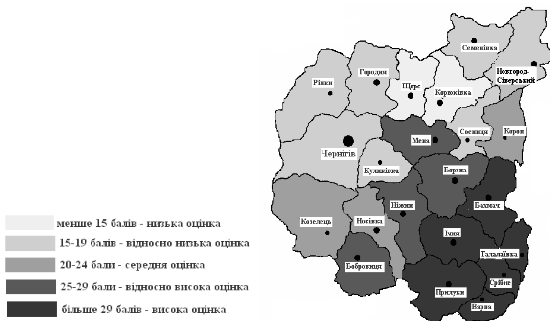
Рис. 1. Комплексна еколого-агрохімічна оцінка стану ґрунтів Чернігівської області

На основі синтезу показників вмісту гумусу, рухомого фосфору, обмінного калію, нітрогену, кислотності та вмісту радіоактивних речовин у ґрунтах по кожному окремо взятому району нами була здійснена комплексна еколого-агрохімічна оцінка ґрунтів Чернігівщини. Для її здійснення всі показники були оцінені бальним методом. Для співставлення показників була обрана єдина 5-ти бальна шкала. На першому етапі роботи використовувалась шкала простих оцінних балів від 1 до 5. Оцінні бали, що були присвоєні кожному з показників, перелічених вище, додавалися і виводилася загальна еколого-агрохімічна оцінка, яка може мати від 6 до 30 балів. У межах зазначених балів нами запропонована їх класифікація (рис.1).