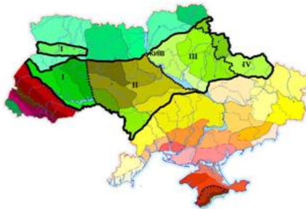
Рис. 1. Фізико-географічне районування України (згідно [1]). Позначення провінцій лісостепової зони: I – Західно-Українська, II – Дністровсько-Дніпровська, III – Лівобережно-Дніпровська, IV – Середньоросійська. Межі зони позначені контуром, провінцій – пунктиром.

Лісостепова зона займає близько третини території України та за фізико-географічним районуванням [1] представлена 4 провінціями (рис. 1): Західно-Українська (ЗУЛП), Дністровсько-Дніпровська (ДДЛП), Лівобережно-Дніпровська (ЛДЛП), Середньо-російська (СРЛП). Переважає височинний рельєф, низовини займають невеликі території на Лівобережжі. Клімат : помірно континентальний, континентальність збільшується із заходу на схід [2]. Річкова мережа : представлена системами річок Дніпро, Південний Буг, Дністер, Сіверський Донець.