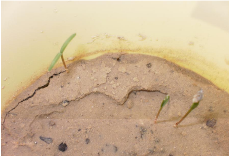
Рис. 2. Сіянци Cupressus sempervirens L.

Проростки (19.03.11) кипарису являють собою нерозгалужені рослини з двома сім'ядолями. Висота таких рослин до 2 см. Хвоя – голкоподібна, утворюється в рік проростання. Коренева система – стрижнева, з 3-5 боковими корінцями II порядку, які за розміром значно поступаються головному кореню (рис. 2).