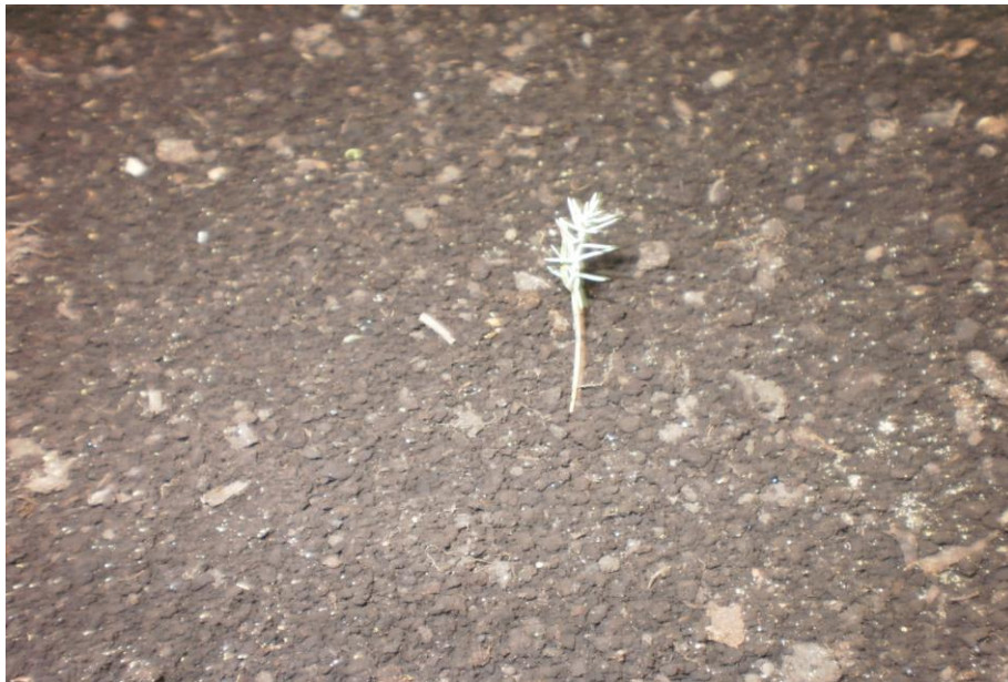
Рис. 3. 4-місячні сіянці Cupressus sempervirens L.

Через чотири місяці після появи сходів (19.07.11), сіянці виростили до 4 см у висоту (рис. 3).