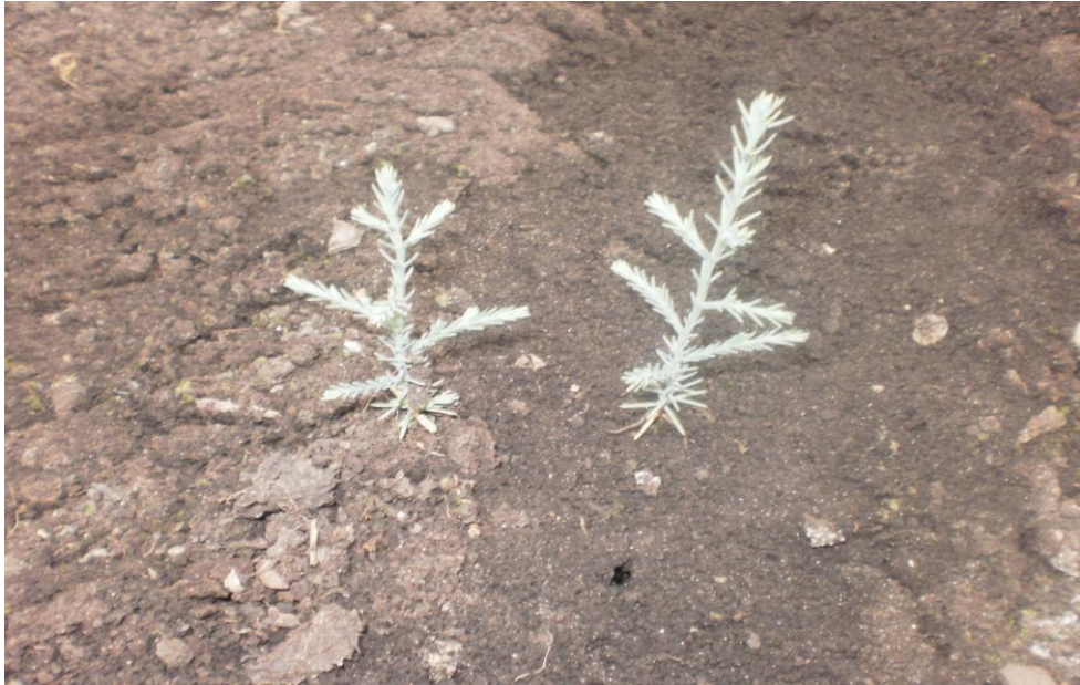
Рис. 4. 8-місячні сіянці Cupressus sempervirens L.

Станом на 19.03.12 досліджувані рослини досягли 17-20 см у висоту (рис. 5).