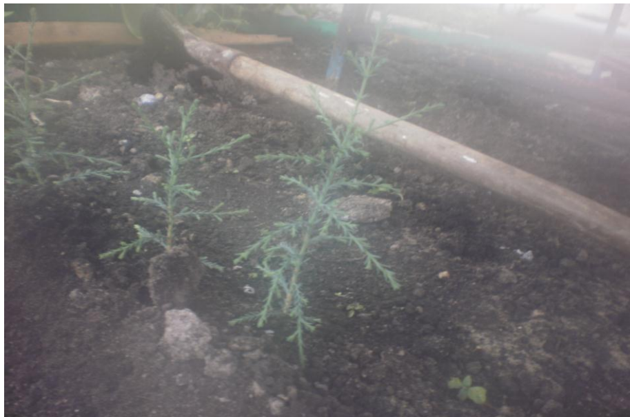
Рис. 5. Однорічні сіянці Cupressus sempervirens L.

Станом на 19.03.12 досліджувані рослини досягли 17-20 см у висоту (рис. 5).