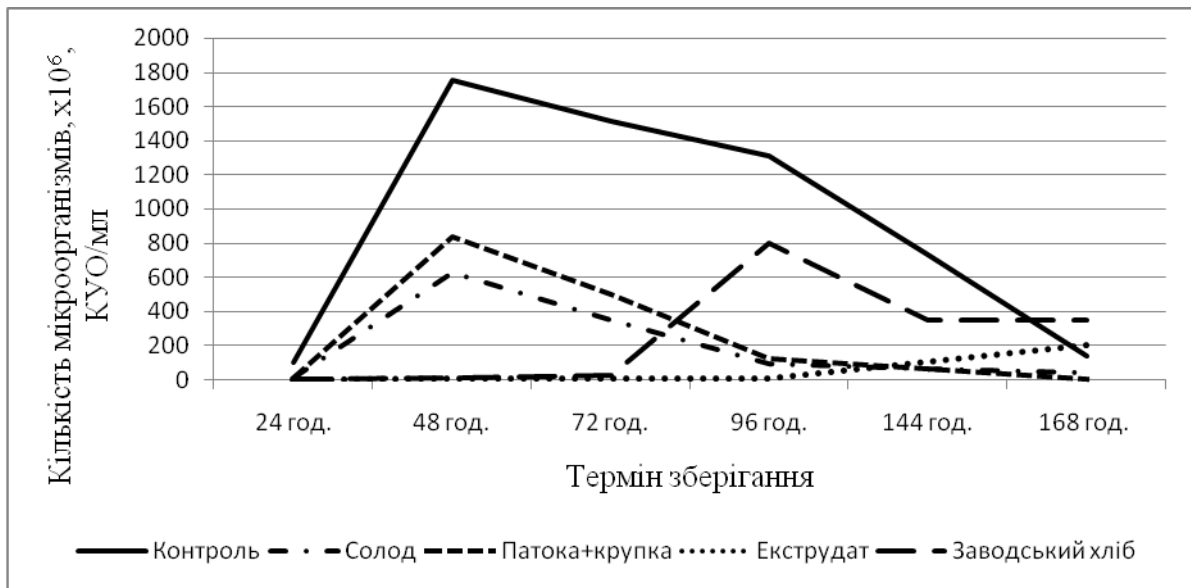
Рис.2. Зміна вмісту мікроорганізмів у хлібі у процесі його зберігання

Відповідно до попередніх досліджень, хліб випечений на заводі стає непридатним до вживання вже на 4 добу через пліснявіння.