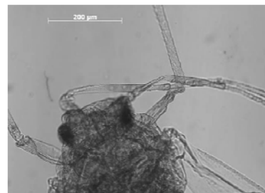
( Myzocallis rhombifoliae Granovsky)