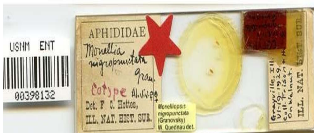
( Monellia nigropunctata Granovsky)

О. Грановським була створена колекція комах, загальна кількість зразків якої становила 30 тис. одиниць, серед яких 20 тисяч – займають попелиці [2]. В ентомологічній колекції Національного музею природознавства Смітсонівського інституту (Smithsonian Institution National Museum of Natural History) мікропрепарати і слайди комах родини Aphididae, які зібрав і виготовив Олександр Грановський зберігаються й до сьогодні (рис.2.).