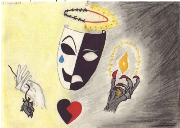
Рис. 1. Я-реальне. Я-ідеальне

Дослідницький матеріал підтверджує діаметрально протилежні спрямування тенденцій психіки, що відображає «Модель внутрішньої динаміки психіки». «Модель» у першу чергу цікава розбіжностями у спрямуванні психіки до просоціально зорієнтованих цінностей, що виражає стрілка 2 і діаметрально протилежна спрямованість енергії на інфантильні цінності (стрілка 5).