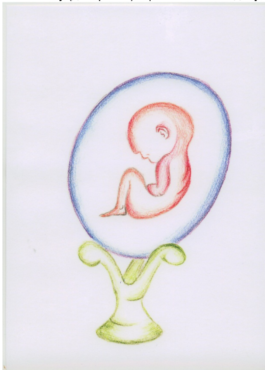
Рис. 2. Моє самовідчуття

Суб'єктивна зінтегрованість породжує феномен хибного кола, коли психіка не призупиняється в прагненнях досягти цілі, нехай і шляхом відступів від реальності та ілюзорної значимості ідеалізованого «Я». Захисна система відзначається можливістю запуску вторинних, третинних і так далі психологічних захистів, які потім людину ослаблюють. Тому на «Моделі» ми бачимо стрілочку «до сили» (стр. 4), яка «залежна» від нормативних цінностей та ідеалу «Я» і стрілочку «до слабкості» (стр. 3), яка гармонізується у своєму спрямуванні із інфантильними цінностями, в яких закладено почуття неповноцінності, меншовартості і повернення до інфантильного стану, аж до утробного стану (див. рис. 2), що ослаблює людину, робить її пасивною, імпотентною.