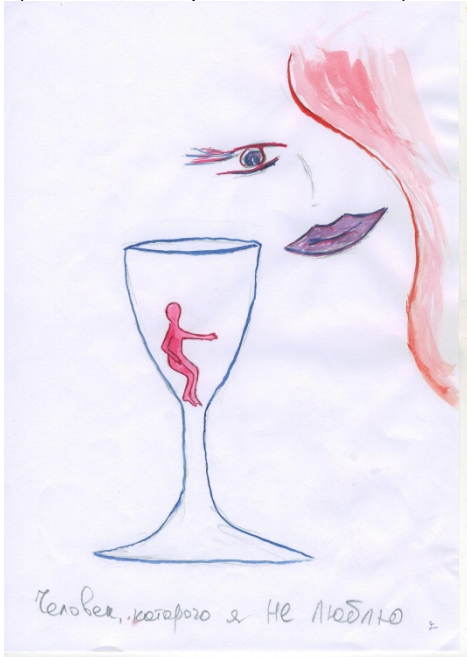
Рис. 3. Людина, яку я не люблю

Для прикладу приводимо ілюстрації малюнків, що засвідчують наявність тенденції повернення в утробу, що знаходить вираження в тенденції до психологічної смерті та психологічної імпотенції (рис. 3 та 4).