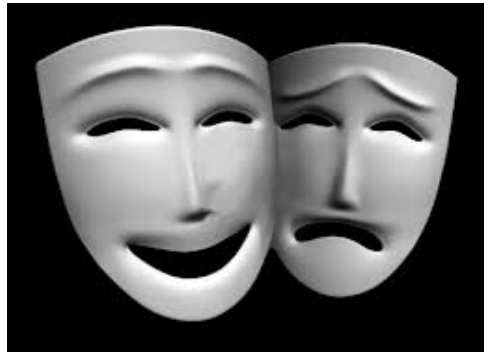
Рис. 1. Архетип маски