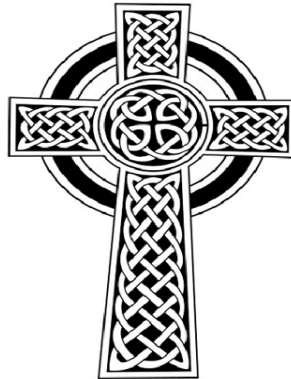
Рис. 3. Архетип хреста