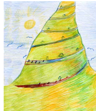
Рис. 6. Шлях мого життя

Наведені фото (1, 3, 4) та психомалюнки (2, 4, 6) дозволяють об'єктивувати спільність архетипної символіки визначеної К. Юнгом з символами психомалюнків. Так на фото 1. «Архетип маски» представлено традиційне зображення архетипу маски, що демонструє за К. Юнгом інтеграцію суперечностей. Такий образ являє єдність протилежних тенденцій адже символізує: захист, таємницю небуття, бажання слідувати вимогами соціуму та водночас слабкість, небажання підкорятися соціальним вимогам, символізувати драму та комедію тощо. На рис 2. «Я серед людей», автор малюнку представив свої відчуття серед людей які окреслив як страх та водночас бажання бути активним, прийнятим у соціальне життя. Маска представлена розділеною навпіл, як символ суперечності у відчуттях та прагненнях, що зумовлює внутрішню дисгармонію. Оточуючі люди також втілені в маску як: лицемірні, мінливі, агресивні.