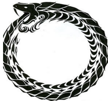
Рис. 5. Архетип уроборосу