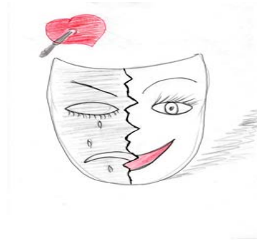
Рис 2. Я серед людей