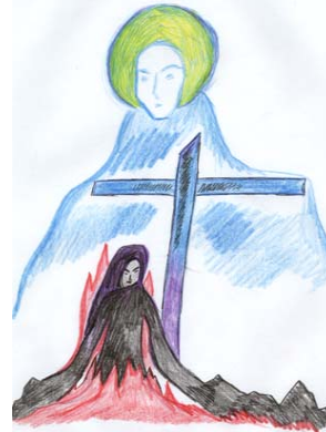
Рис. 4. Покаяння