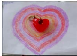
Фото 6. Моє майбутнє

Е.: Тоді буде інший колір і розмір (фото 6).