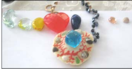
Фото 3. Модель «Динаміка розвитку відносин Е.»

П.: Як змінювались ваші почуття? Можете розставити камінці?