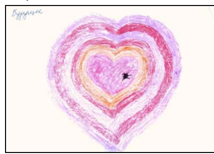
Рис. 2. Майбутнє

Е. зосередила увагу П. на ліпці (фото 1.) на якій зверху зверху поклала квадратний голубий камінь.