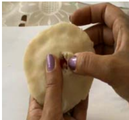
Фото 2. Розривання Е. презентанта

Е.: Це моє тіло (презентант з тіста), я така товста, з целюлітом, а в середині є серце (перевертає і показує, що серце знаходиться всередині, повністю залиплене тістом, фото 2, 2а). Його не треба нікому показувати, а необхідно ховати, ніхто його не бачить, його як не має.