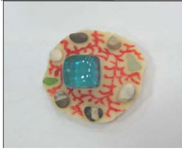
Фото 1. Модель Л. «Я тепер»