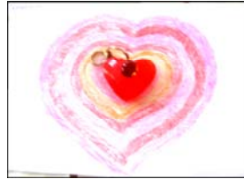
Фото 4. Бажаний етап відносин в майбутньому

П.: Камінці символізують певний етап, почуття і т. п. Який етап ви б хотіли пережити ще в майбутньому (рис. 4)?