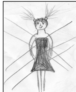
Рис.5. Я реальное (М. 9 лет)

Если презентованная в рисунке позиция мамой укрепитя, то у ребенка стабилизируется чувство неполноценности, которое будет мешать в жизни. Тревожным звоночком является то, что до начала работы с психологом девочка проговаривала, что «ненавидит себя за то, что у нее не всегда получается делать все хорошо». При выполнении заданий на уроках тормозом было чувство - «Я не справлюсь», «У меня не выйдет». В рисунке «Я реальное» нарисовала бесцветную девочку, которую потом всю перечеркнула несколько раз (см. рис. 4).