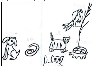
Рис.1. Моя семья (М. 9 лет)

В рисунках проявляется механизм намека, смещение естественных свойств предметов, что и способствует передаче психологического содержания в рисунках.