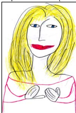
Рис.2.а. Я идеальная (Е. 8лет)

Например, рисунки 2.а и 2.б протагонист А. (8 лет) передала «Я идеальное» введением цвета.