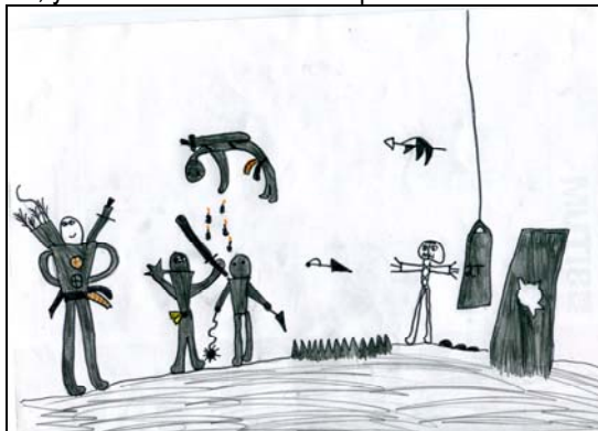
Рис.8. Я среди мальчиков (А.8 лет)

Обращает на себя внимание рисунок протагониста А. (8 лет) «Я среди мальчиков». В рис. 8 ребенок нарисовал себя человеком, который подпрыгнул и висит в воздухе. Не имея возможности подробно останавливаться на анализе рисунка, укажем только на некоторые важные моменты.