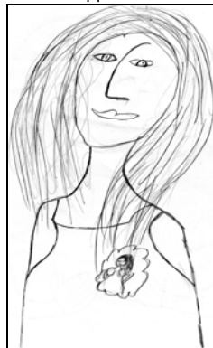
Рис.2.б. Я реальное (Е. 8лет)

Диалогическое взаимодействие с респондентом обнаружило архетипическую нагрузку цвета, дистантное расположение фигур, положение выше – ниже, как и использование цвета.. К примеру девочка убеждала, что себя она видит в цвете обесцвеченность же появляется когда она на кого то обижается. Иногда в детских рисунках проявляется тенденция к психологической смерти через омертвление детьми как любого объекта, так и