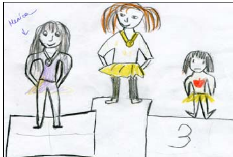
Рис. 4. Я идеальное (М. 9лет)

Архетип срощен с психикой в ее целостности, включая систему психологических защит, в частности, механизмы идентификации с матерью. Поэтому мама презентована ученицей на первом месте, а дочь (она) на втором, подруга на третьем (см. рис. 40).