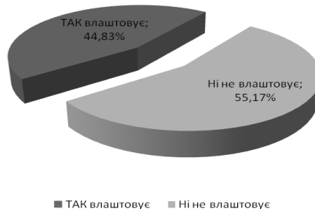
Рис. 1. Результати відповідей студентів, опитаних щодо відношення до змісту занять з фізичного виховання (%)

У дослідженні брали участь 290 студентів вищих навчальних закладів, зокрема, 60 студентів Академії митної служби України м. Дніпропетровськ (АМСУ), 58 студентів Дніпропетровського національного університету залізничного транспорту імені Всеволода Лазаряна (ДНУЗТ імені Всеволода Лазаряна), 66 студентів Івано-Франківського національного технічного університету нафти і газу (ІФНТУНГ), 46 студентів Придніпровської академії будівництва та архітектури (ПДАБА), 60 студентів Дніпропетровського національного університету імені Олеся Гончара (ДНУ імені Олеся Гончара). Результати відповідей студентів на запитання анкети «Чи влаштовує Вас зміст занять з фізичного виховання?» дозволив з'ясувати, що із 290 студентів повністю влаштовує зміст занять з фізичного виховання у вищих навчальних закладів – 44,83%, а 55,17% – не влаштовує зміст занять опитаних, (рис. 1).