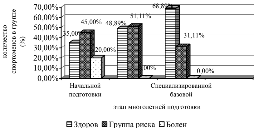
Рис. 2. Распределение юных спортсменов, в зависимости от реабилитационного диагноза (по данным количественной оценки уровня соматического здоровья) после реализации технологии (n=260)