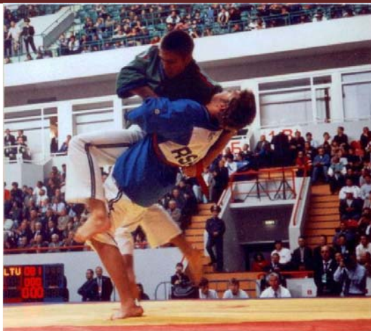
Рис. 4. IV чемпіонат світу по боротьбі на поясах Алыш

. Перший чемпіонат світу по українській національній боротьбі на поясах був проведений в 2006 році в місті Одеса (Україна) при проведенні V чемпіона світу по боротьбі на поясах Алыш і за підтримки Міжнародної Федерації боротьби на поясах Алыш (рис.5).