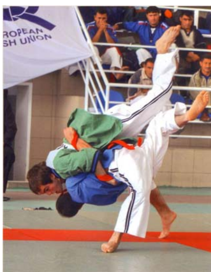
Рис.5. Офіційна прем'єра української національної боротьби на поясах в програмі V чемпіона світу по боротьбі на поясах Алыш в Одесі (2006 рік)

. Перший чемпіонат світу по українській національній боротьбі на поясах був проведений в 2006 році в місті Одеса (Україна) при проведенні V чемпіона світу по боротьбі на поясах Алыш і за підтримки Міжнародної Федерації боротьби на поясах Алыш (рис.5).