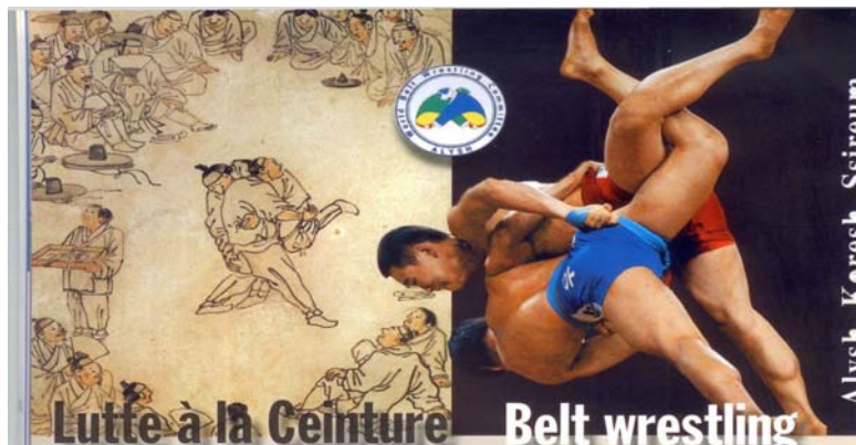
Рис.1. Всесвітній комітет боротьби на поясах в складі UWW (ФІЛА)

Сім'я спеціальних бойових стилів, відомих по їх оригінальних назвах: Alysh, Koresh, Ssireum, Ukraine - отримали всесвітнє визнання у усіх, що займаються боротьбою у світі і вже має своє представництво в UWW (World Union of Wrestling – легального правонаступника Міжнародної Федерації асоційованих видів боротьби (FILA) з 2014 року) у вигляді Всесвітнього комітету поясної боротьби (президент Комітету Гинтаутас Вилейта - Литва) (рис.1).