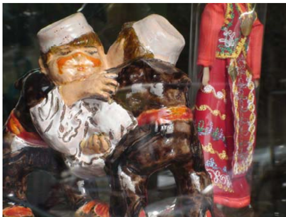
Рис.2. Поясна боротьба на Балканах (скульптури в Тірані - Албанія)

Так, під час проведення в 2000 році Конгресу ІКА в Анталії (Туреччина) Байман Еркінбаєв (Киргизія) і Гинтаутас Вилейта (Литва) запропонували почати розвиток поясної боротьби у рамках ІКА (вона успішно поширюється на Європейському континенті, в Азії, Африці і Америці) (рис.2).