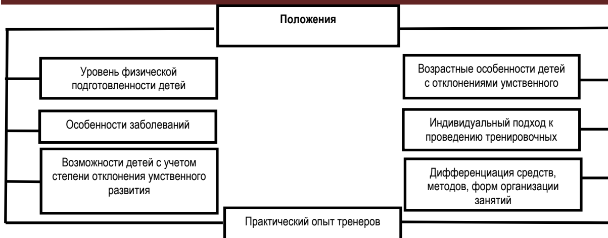
Рис. 1 Основные положения, определяющие построение авторской программы Специальных Олимпиад по футболу

Для данного контингента футбол является командным игровым видом спорта, который выступает в роли средства их социальной интеграции, содействует улучшению уровня здоровья, физической подготовленности, которая будет способствовать лучшей социально-бытовой адаптации в общественной жизни.