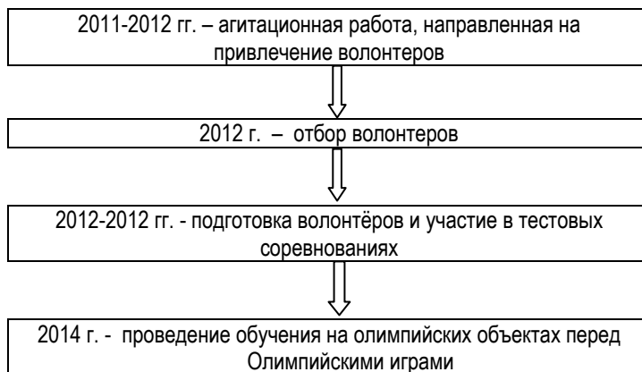
Рис. 1. Этапы процесса работы с волонтерами XXII Олимпийских зимних и XI Паралимпийских зимних Игр 2014 года

Исследования позволяют говорить о том, что процесс работы с волонтерами на XXII Олимпийских зимних и XI Паралимпийских зимних Играх 2014 года в г. Сочи был разделен на 4 этапа (рис 1).