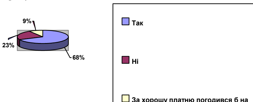
Рис.3 Чи погодилися на роботу, умови якої Вам протипоказані?

Організація власної справи є особливо привабливою формою праці для інвалідів [4]. Це пов'язано з тим, що самозайнятність дає людині значну свободу дій, можливість проявити себе й отримувати доходи відповідно до кількості і якості затраченої фізичної та розумової праці, вкладеного капіталу. Проте за сучасних умов, уразливим категоріям працездатного населення, до якого належать й інваліди, дуже складно прийняти рішення щодо відкриття власної справи. Вочевидь, це не може не позначитися на відповідях осіб з обмеженими фізичними можливостями на питання: «Чи виникало у вас бажання організувати власну справу з урахуванням професійного досвіду?». За даними опитування кількість тих, хто хотів би відкрити власне підприємство становить лише 3%. Серйозними причинами, що заважають інвалідам спробувати себе у бізнес-діяльності є: економічна і політична нестабільність; високі податки; недосконалість законодавства щодо самозайнятості населення та захисту його прав. При підборі роботи важливо враховувати умови праці, що передбачає професія, а також умови праці на конкретному робочому місці [5]. Їх слід оцінювати з огляду на наявні функціональні обмеження чи стан здоров'я. Проте, відповідаючи на запитання: «Чи погодилися на роботу, умови якої Вам протипоказані?» - 68% опитуваних обрали відповідь «Так» (рис.3).