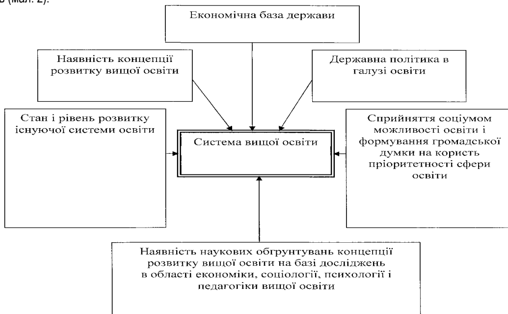
Мал. 2. Вплив на систему вищої освіти зовнішніх чинників

Щодо перспектив розвитку системи вищої освіти дослідники визначають ряд чинників, що мають на неї безпосередній вплив (мал. 2).