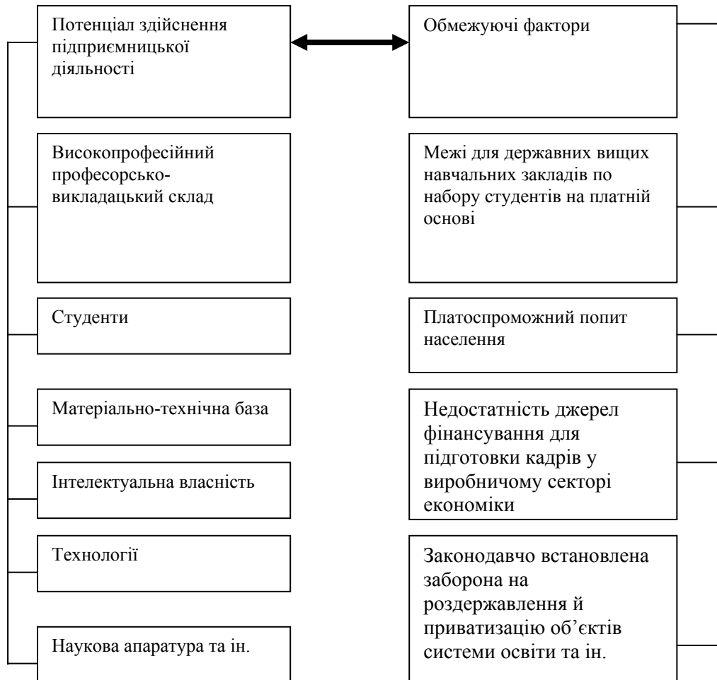
Рис. 2. Потенціал і межі здійснення підприємницької діяльності державних вузів

Це висококваліфіковані кадри професорів і викладачів, матеріально-технічна база, значна інтелектуальна власність, наявний парк наукової апаратури та ін. Поряд із цим існують обмежуючі чинники, що стримують розвиток діяльності, яка приносить прибуток. Серед них одним із суттєвих є законодавчо встановлений норматив набору студентів на платній основі.