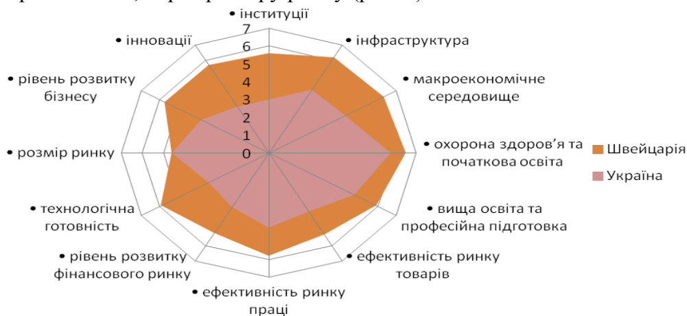
Рис. 1. Порівняння профілів конкурентоспроможності Швейцарії та України за ІГК 2013 – 2014 рр.

За результатами звіту з конкурентоспроможності 2013–2014 рр. першу позицію посіла Швейцарія, в десятку лідерів також входять Сінгапур, Фінляндія, Німеччина, США, Швеція, Гонконг, Нідерланди, Японія, Великобританія. Як свідчать представлені дані, Україна поступається Швейцарії за всіма складовими конкурентоспроможності, окрім розміру ринку (рис. 1).