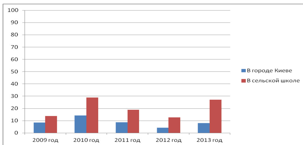
Рис. 2. Данные о количестве выпускников, которые не трудоустроились (в %)

Выводы. Проблема трудоустройства умственно отсталых лиц, очень часто является одной из причин бедности семей, в которых они воспитываются и проживают. Находят ли они работу на рынке труда? Этот вопрос мало изученный в современных исследованиях. В специальных (коррекционных) школах выпускники получают специальности, но они не всегда востребованы в современном обществе. Изучение этой проблемы очень актуально сегодня.