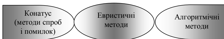
Рис. 2. Структурна схема простору методів розв’язування задач

Фізичні задачі є інструментом “пізнання, розвитку мислення і творчих здібностей” [1, с.7]. Діяльність учнів під час розв’язування фізичних задач, яка зводиться до спроб і помилок або до намагання випадково знайти відповідну формулу деякими дослідниками називається “конатус” або намагання виконати щось безпосередньо, тобто, зовсім неефективний метод розв’язування задач [2, с. 23]. Таку саму діяльність або спосіб пошуку розв’язків без попереднього планування, усі дії на шляху спроб і помилок названо у роботі В.О.Моляко [6, с. 52] стратегією “випадкових підстановок”. Евристичні методи характеризують за допомогою так званого “простору методів розв’язування задач” [2, с. 23], в якому можна виділити континуум методів, який має два полюси, а саме: алгоритм, або ефективний метод розв’язування деякого чітко визначеного класу завдань, та “конатус” – метод проб і помилок. Поміж ними знаходиться клас евристичних методів, які не є повністю ефективними та характеризуються спеціалізацією, узагальненням і стосуються, здебільшого, творчої діяльності (рис. 2).