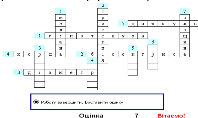
Рис. 3. Скріншот частково заповненого кросворду з автоматично виставленою оцінкою

автоматично після натискання перемикача «Роботу завершити. Виставити оцінку» (Рис. 3.). Після цього учневі буде повідомлена оцінка результатів його роботи.