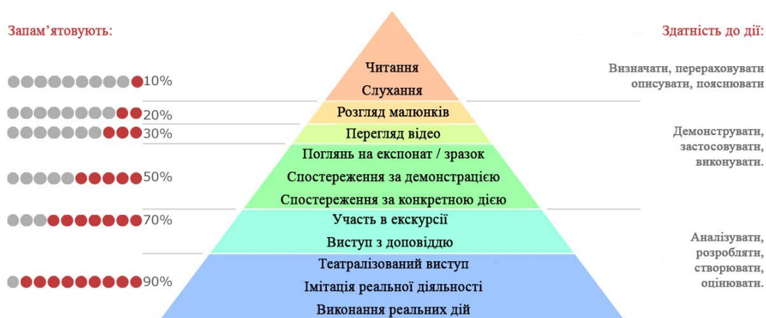
Рис. 1. Конус навчання Едгарда Дейла