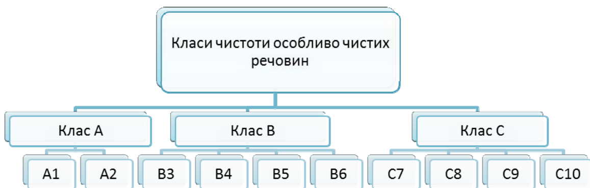
Рис. 3. Розподіл особливо чистих речовин на класи

Для більш детального оволодіння цими поняттями можна запропонувати розподіл особливо чистих речовин (рис. 3).