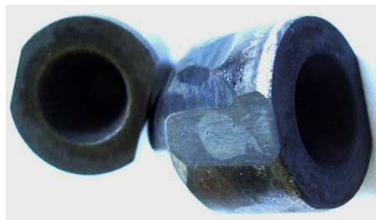
Рисунок 3 – Загальний вигляд експериментального твердосплавного зубка, підданого металографічним випробуванням

Перед випробовуванням твердосплавні зубки були піддані неруйнівному контролю шляхом вимірювання коерцитивної сили на коерцитиметрі ИКС-8. Таке вимірювання ґрунтується на намагнічуванні твердосплавного зубка в постійному магнітному полі до стану магнітного насичення і знятті показів напруги поля зворотного напрямку циклу, необхідного для повного розмагнічування зубка. Також були проведені металографічні дослідження на спеціально підготовлених поверхнях дослідних зубків (рис. 3).