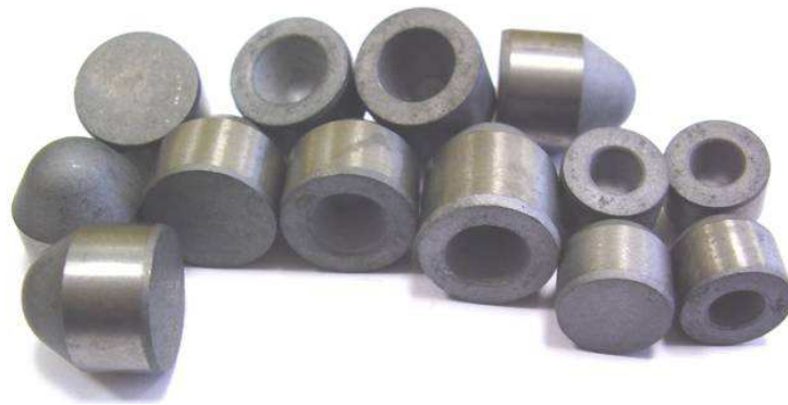
Рисунок 2 – Загальний вигляд серійних і експериментальних ( з пустотілим хвостовиком) твердосплавних зубків