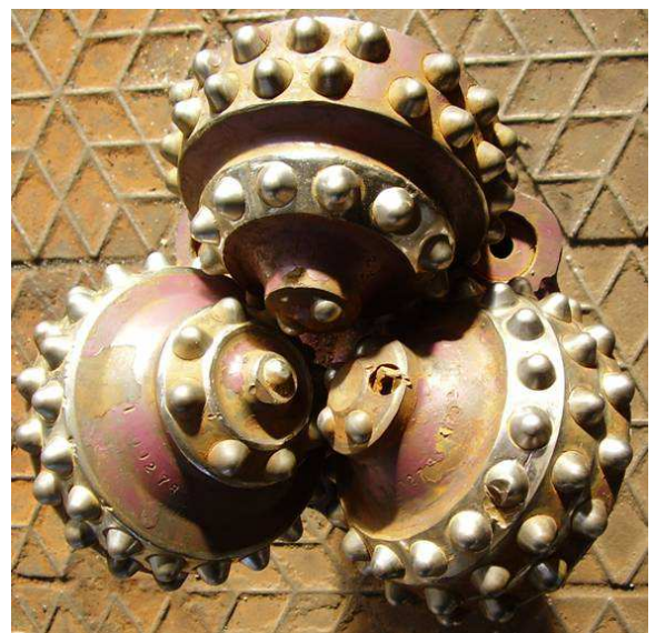
Рисунок 5 – Загальний вигляд оснащення тришарошкового бурового долота 250,8 ТКЗ – ПГВ – Д27Б з експериментальними зубками, що відпрацьовувало в стендових умовах 30 годин

ком працездатним (рис 5), а подальші руйнування легко спрогнозувати, то буріння було припинене. Необхідно зауважити, що при такому руйнуванні цільних твердосплавних зубків утворюється на половину більша кількість фрагментів, що призводить до інтенсивного руйнування як вінців шарошки, так і вставних зубків. Особливого навантаження при цьому зазнають середні, найбільш навантажені вінці даної конструкції шарошок, а також вершини шарошок, особливо №2 і №3 та встановлені тут зубки.