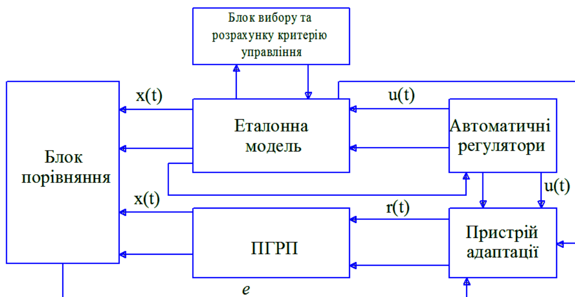
Рисунок 2 – Блок-схема адаптивної системи з еталонною моделлю.

Отже, дані міні-ГРП дають можливість заздалегідь визначити еталонну модель процесу ГРП, згідно з апіорною інформацією про вхідні дії.