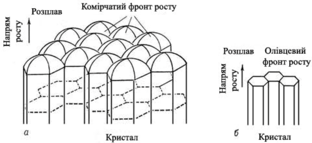
Рисунок 1 – Структурутворення парафінових вуглеводнів