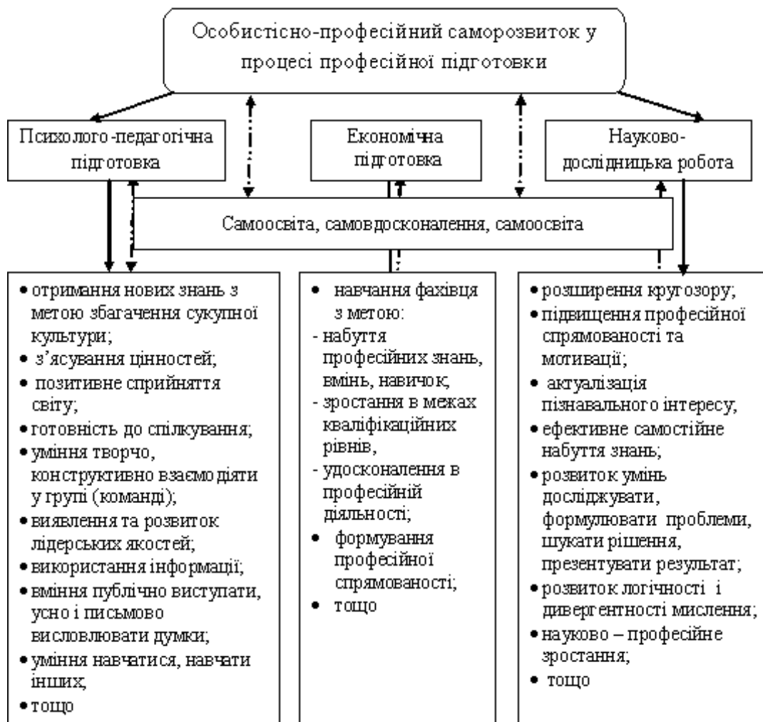
Рис. 1. Особистісно-професійний саморозвиток у процесі навчання

Це пояснюється тим, що, по-перше, науково-дослідницька робота студента створює умови для налагодження контактів зі спеціалістами галузі, отримання поглибленої інформації щодо економічних досліджень ринку, закордонного досвіду розвитку бізнесу, ознайомлення науково-педагогічної спільноти з результатами своєї роботи через публікації та участь у конференціях, тематичних семінарах, інших комунікативних заходах.