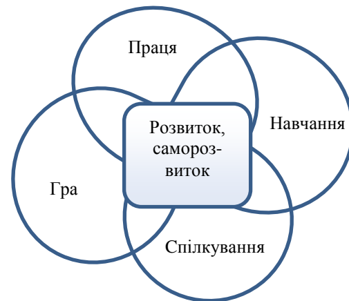
Рис. 3. Місце розвитку та саморозвитку в діяльності людини

Особливістю програми модифікованого курсу є цілеспрямоване навчання студентів здійснення ними управління саморозвитком, теоретичне обґрунтування та узагальнення практичної реалізації чого розкривається в темі «Управління саморозвитком», а безпосереднє навчання здійснюється упродовж всього курсу на тренінгових заняттях (Табл.1). Обов'язковою вимогою до кожного студента є створення власного