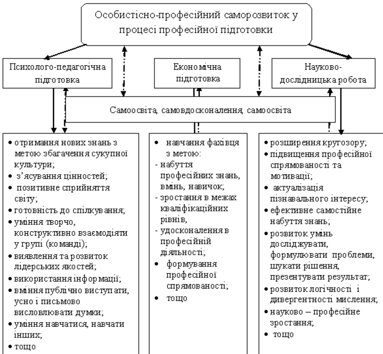
Рис. 1. Особистісно-професійний саморозвиток у процесі навчання

По-третє, активне і ефективно залучення студентів до науково-дослідницької роботи з різних дисциплін сприяє підвищенню їх професійної спрямованості та науково-професійному розвитку: успіх у навчальній і науковій діяльності мотивує студентів до самовдосконалення та особистісно-професійного саморозвитку упродовж подальшої професійної діяльності; участь у наукових конференціях розширює кордони особистісних досягнень студентів, а значить, у довгостроковій перспективі, підвищує їх конкурентоспроможність.