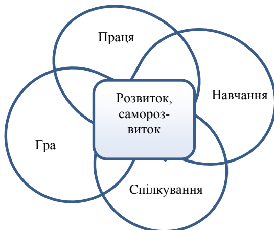
Рис. 3. Місце розвитку та саморозвитку в діяльності людини

Провідною метою викладання теми "Активність особистості. Діяльність. Види діяльності" є спрямування студентів на свідоме планування, контроль та аналіз ефективності своєї діяльності, врахування в ній своїх індивідуальних особливостей, спрямування на особистісне зростання, реалізацію свого творчого потенціалу. В ній передбачається усвідомлення майбутніми професіоналами, що діяльність є єдиною можливістю людини реалізувати себе, що саме в об'єднанні основних чотирьох її видів - праці, гри, спілкуванні, навчанні - є місце розвитку та саморозвитку особистості (Рис. 3).