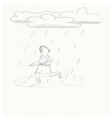
Рис. 5 Рисунок женщины с высокой самооценкой в ситуации стресса

Интересны рисунки женщин с высокой самооценкой в состоянии стресса (рис. 5). Так характер-