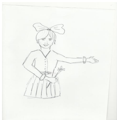
Рис. 4 Рисунок женщины с высокой самооценкой в ситуации эмоциональной стабильности

В группе женщин с высокой самооценкой себя как матери рисунки в состоянии эмоциональной стабильности хоть и располагались в верхней части листа, но при этом отличались отсутствием значимых деталей (ног, туловища) (рис. 4). Таким образом, обнаружилось несоответствие между самооценкой себя как матери по методике Будасси и результатами проективной методики (в данном случае, отсутствие ног – неустойчивость, напряжение, отсутствие стержня, равновесия).