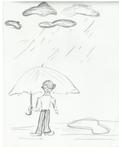
Рис. 3 Рисунок женщины с низкой самооценкой в ситуации стресса

пола (рис. 2), рисунок занимал среднюю часть листа или весь лист, что не соответствовало критериям низкой самооценки. Однако даже в ситуации относительной безопасности женщины прорисовывали тучи, что согласно интерпретации свидетельствует об эмоциональных проблемах. Неуверенность в своих силах отражена в прерывистых двойных линиях, штриховке.