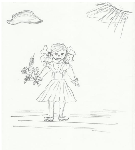
Рис. 2 Рисунок женщины с низкой самооценкой в ситуации эмоциональной стабильности

Анализ результатов методики "Человек под дождем" выявил некоторые особенности реагирования в стрессовых ситуациях женщин с разным восприятием себя как матери. Так, женщины с низкой самооценкой себя как матери в эмоционально стабильном состоянии в трех случаях из четырех рисовали фигуры своего