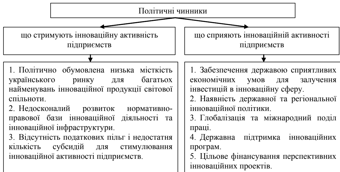
Рис. 1. Політичні чинники, що впливають на інноваційну активність підприємств

“Про інноваційну діяльність” статей 21 і 22, що містили в собі особливості в оподаткуванні та митному регулюванні інноваційної діяльності. Після цього він практично втратив свій сенс і по суті перетворився на суто декларативний документ, в якому визначається певна термінологія і розповідається про поширені в світі механізми впливу держави на інноваційні процеси, але жоден з цих механізмів реально не запроваджується. На сьогоднішній день чинна законодавча база науково-технологічного та інноваційного розвитку, незважаючи на значні зусилля, витрачені на її розробку, не відповідає сучасним вимогам і практично не впливає на темпи такого розвитку. У ній лишаються невирішеними питання: податкових пільг та субсидій, необхідних для стимулювання інноваційної діяльності та витрат на наукові дослідження; розробки, формування інноваційних венчурних фондів; митних пільг для науково-дослідних установ, що закуповують наукові прилади й експериментальне обладнання за кордоном.