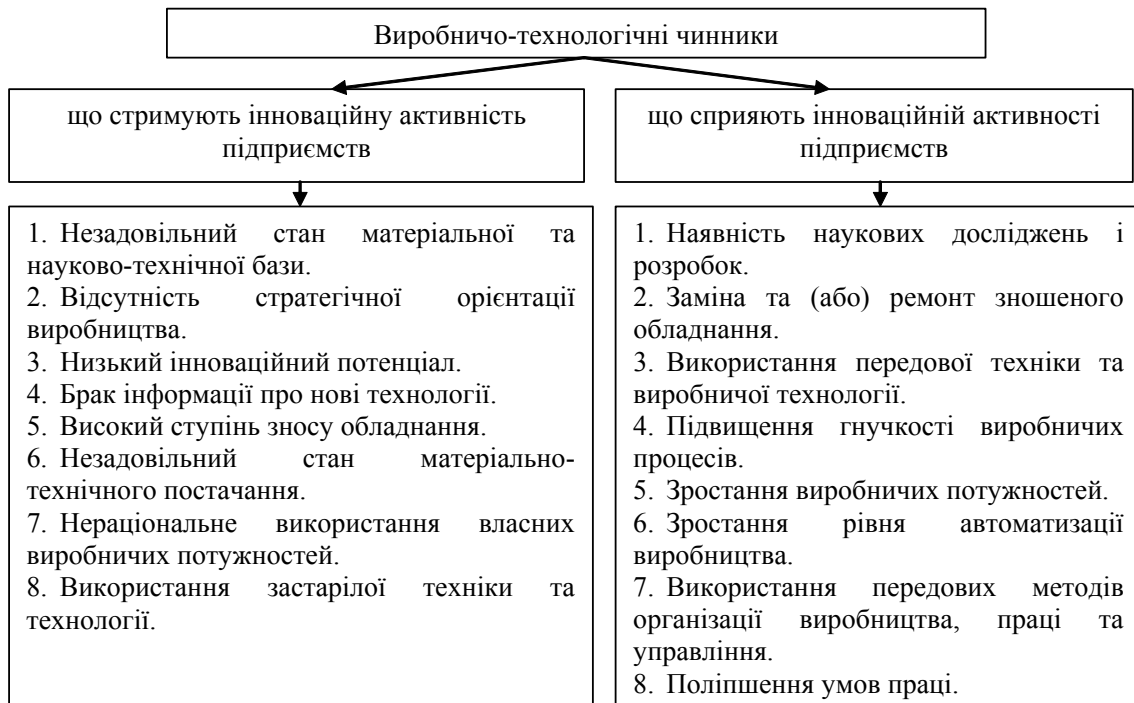
Рис. 3. Виробничо-технологічні чинники, що впливають на інноваційну активність підприємств

Проводячи подальший аналіз, пропонуємо виділити виробничо-технологічні чинники, що впливають на інноваційну активність (рис. 3).