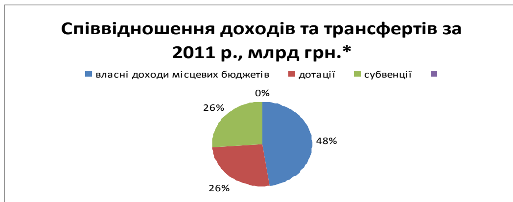
Рис. 2. Співвідношення доходів і трансфертів у 2011 р. (складено автором самостійно на основі [4])

Міжбюджетні трансферти з державного бюджету перераховуються місцевим бюджетам з рахунків державного бюджету органами державного казначейства. Перерахунок дотацій вирівнювання проводиться за допомогою нормативів щоденних відрахувань від кошика доходів державного бюджету для надання міжбюджетних трансфертів. Перерахування коштів до державного бюджету з місцевих бюджетів здійснюється також органами державного казначейства за рахунок фактичних надходжень доходів відповідних місцевих бюджетів згідно з нормативами щоденних відрахувань [6, ст.108].