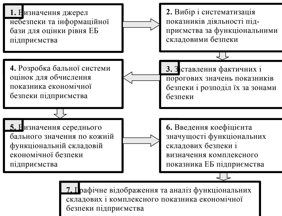
Рис. 2. Алгоритм оцінки рівня економічної безпеки підприємства

Пропонується методика оцінки рівня економічної безпеки підприємств, яка за алгоритмом висвітлює етапи загального аналізу і передбачає визначення комплексного показника економічної безпеки підприємства та його рейтингову оцінку (рис. 2).