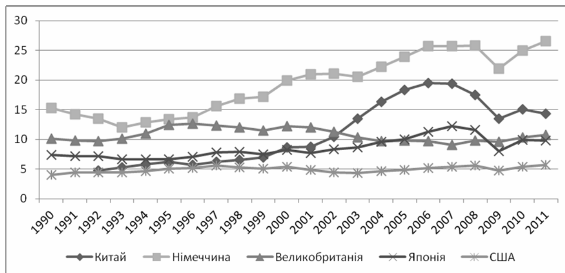
Рис. 3. Частка експорту наукомісткої продукції у ВВП країн, 1990–2011 рр., % [3]

Таким чином, наслідки світової фінансово-економічної кризи та політики з її подолання суттєво змінюють тенденції сучасного світогосподарського розвитку – відбуваються зрушення в міжнародному та міжрегіональному поділі праці, трансформуються гео економічні ролі розвинутих країн та країн, що розвиваються.