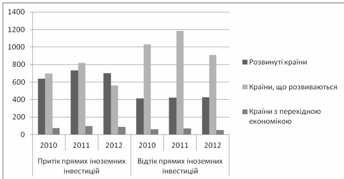
Рис. 2. Світові потоки прямих іноземних інвестицій, млрд дол. США [4]

обумовлюватиме подальше переформатування інвестиційних потоків у середньо- і довгостроковому періоді.