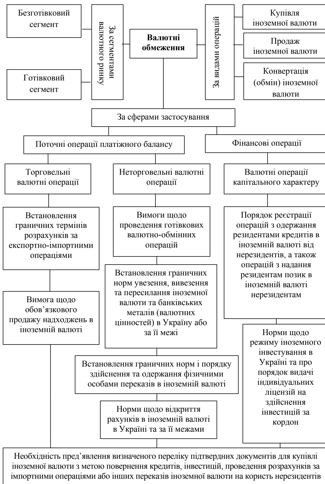
Рис. 2. Класифікація валютних обмежень в Україні

з експорту та імпорту товарів, а також запроваджувати вимоги щодо обов'язкового продажу частини надходжень в іноземній валюті.