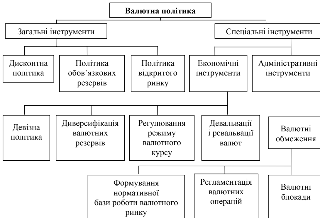
Рис. 1. Інструменти реалізації валютної політики [4, с. 108]

відповідних нормативно-правових актів Національного банку України у формі постанов Правління Національного банку.