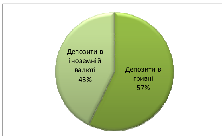
Рис. 2. Структура депозитів за валютами 01.10.2012 р. [6]