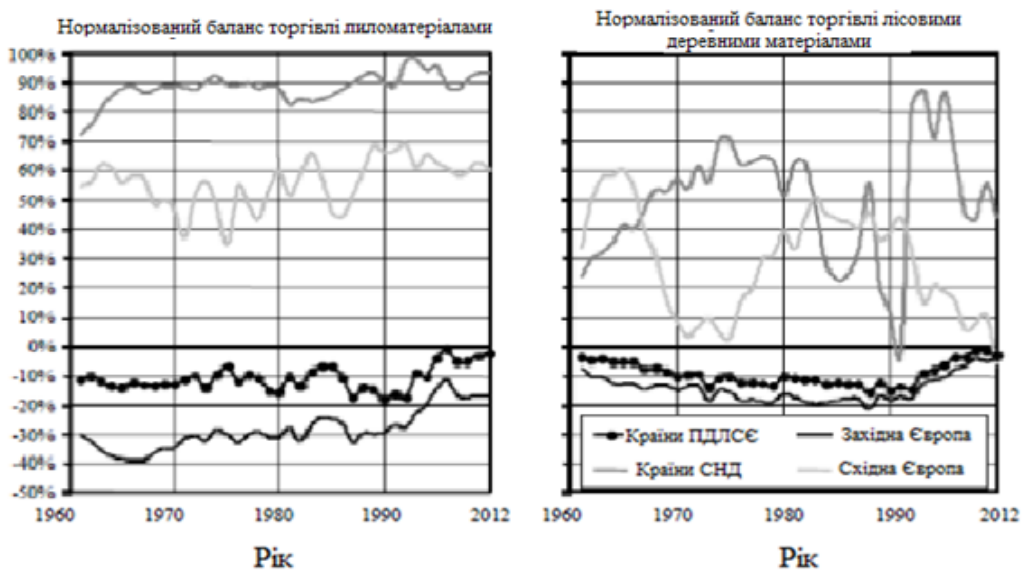
Рис. 2. Довгострокові тенденції у нормалізованому балансі торгівлі пиляними і листовими лісоматеріалами [1]

Сьогодні Європа являє собою невеликого нетто-експортера лісових товарів (у вартісних показника) на регіональному і субрегіональному рівнях. Це також показано на рис. 1. Більш повне уявлення про тенденції зміни торговельного сальдо можна отримати на основі тенденцій зміни нормалізованих балансів торгівлі основними категоріями продукції, які зображено на рис. 2 і рис. 3.