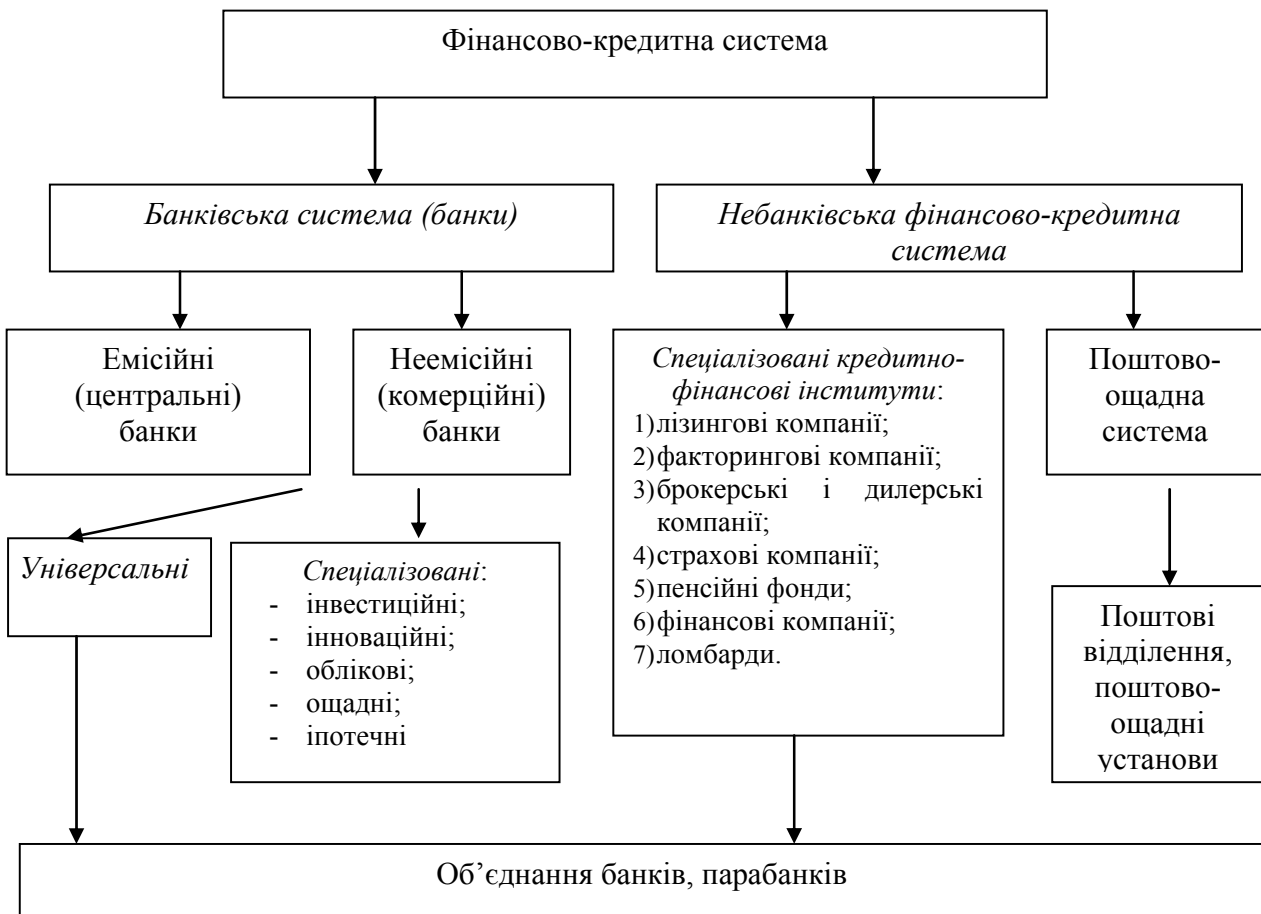
Рис. 2. Структура фінансово-кредитної системи України

посередництва є «широким» підходом, тому що включає допоміжні фінансові установи, біржі тощо.