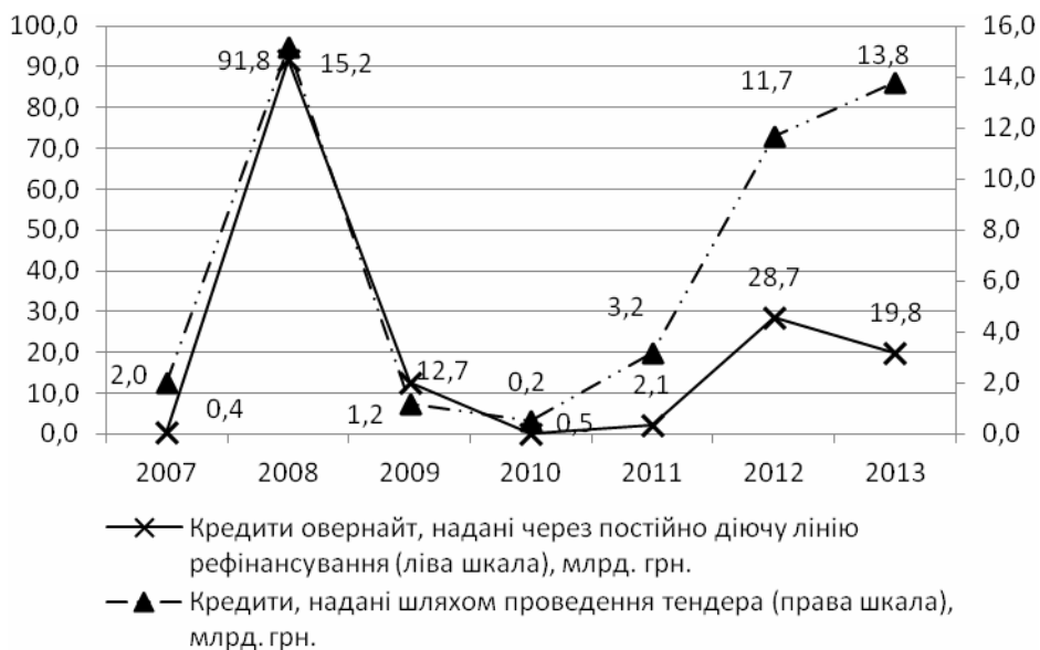
Рис. 3. Динаміка кредитів овернайт та наданих шляхом проведення тендера у 2007–2013 роках

Як свідчать статистичні дані (рис. 1), на початку 2009 р. банківська система України мала проблему щодо масової заборгованості за кредитами. Для мінімізації ризиків неповернення кредитів НБУ залишив за собою право призначати куратора у банк, обмежувати обсяги активних операцій, забороняти видачу нових кредитів та залучення нових вкладників тощо [2]. Куратори у банку або тимчасова адміністрація назначалася для тих установ, які звертались до НБУ з проханням пролонгації кредитів рефінансування, що з боку позичальників розглядалося як санація [3].