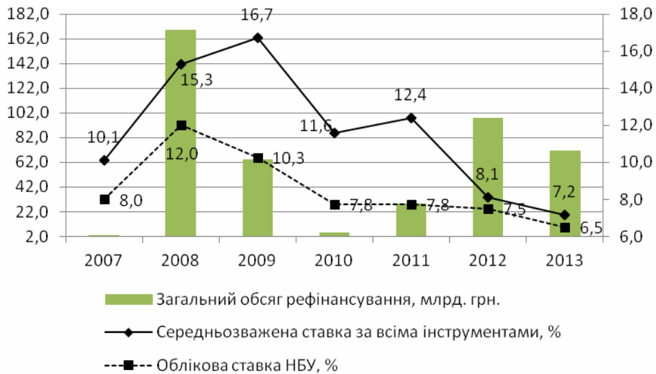
Рис. 2. Динаміка обсягів та процентних ставок рефінансування банків України у 2007–2013 роках

призводить до зниження ліквідності банків НБУ вимушений активізувати механізми рефінансування. Під час глобальної фінансової кризи 2008 р. НБУ був не готовий ефективно діяти, дуже часта і швидка зміна вимог для одержання кредитів рефінансування не давала змоги вітчизняним банкам своєчасно відреагувати на них і відповідно отримати підтримку своєї ліквідності.