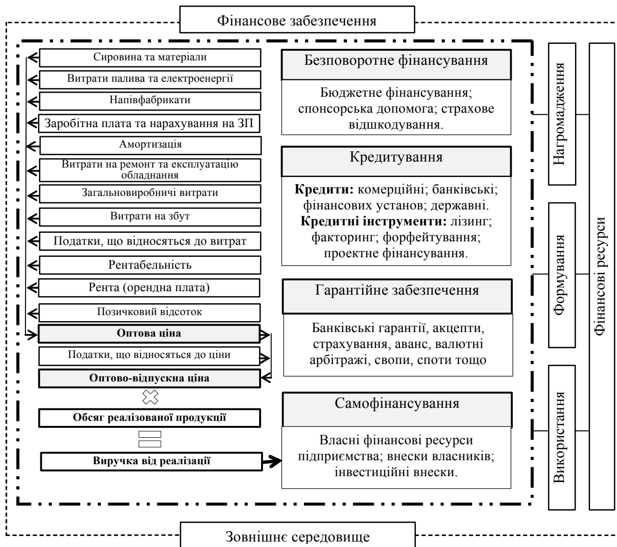
Рис. 1. Процес формування ціни у фінансовому забезпеченні молокопереробних підприємств