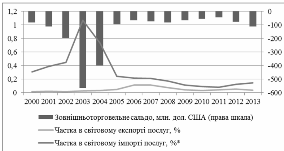
Рис. 10. Показники зовнішньої торгівлі України страховими послугами за 2000–2013 рр.

Частка страхових послуг у структурі експорту послуг України протягом досліджуваного періоду зростає з 0,1 % до 0,2 %, а в структурі імпорту знизилась з 3,3 % до 1 %. Частка України в світовому експорті страхових послуг зростає з 0,01 % у 2000 році до 0,04 % у 2013 році, а частка в світовому імпорті даних послуг зменшилась з 0,3 % у 2000 році до 0,15 % у 2013 році (пікове значення частки України в світовому імпорті даного виду послуг було зафіксовано в 2003 році – 1,07 %, щодо експорту то пікові значення цього показника припадають на 2006–2007 рр. – 0,11 %). Зовнішньоторговельне сальдо страхових послуг було від’ємним протягом всього досліджуваного періоду, мінімальні значення були зафіксовано в 2003 та 2004 р., відповідно – -0,57 млрд дол. США та -0,4 млрд дол. США (рис. 10).