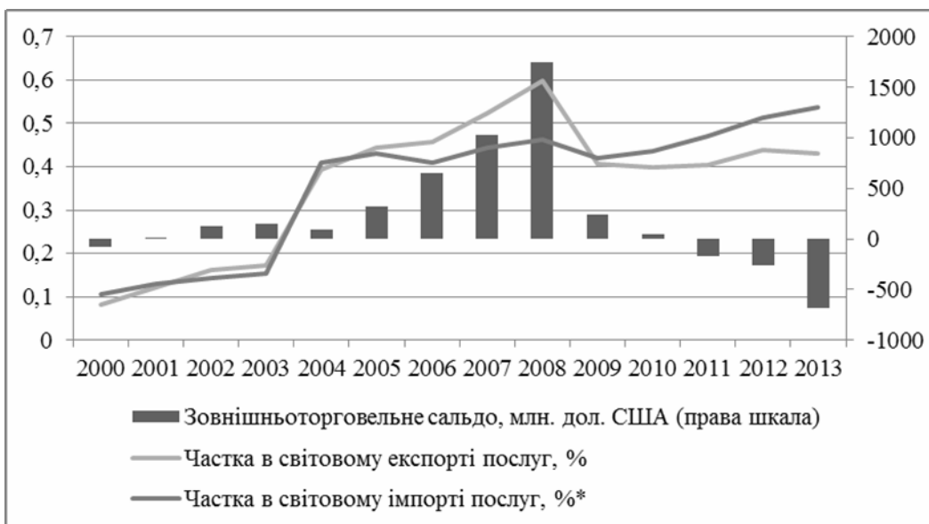
Рис. 2. Показники зовнішньої торгівлі України туристичними послугами за 2000–2013 рр.

Третя найбільша за обсягами експорту у 2013 група послуг – інші бізнес-послуги. До цієї групи послуг, як вже згадувалось в роботі, відносять обслуговування торгових операцій, лізинг, юридичні послуги, консалтинг, послуги зі зв'язків з громадськістю, маркетингові дослідження, вивчення громадської думки, інжиніринг та ін.