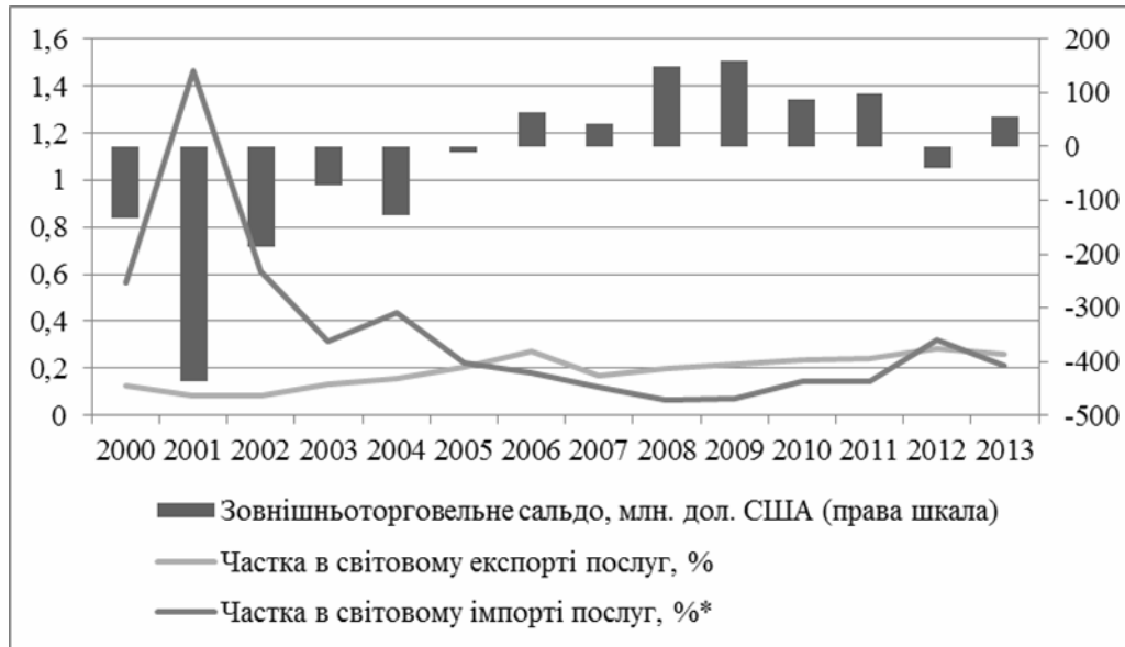
Рис. 7. Показники зовнішньої торгівлі України будівельними послугами за 2000–2013 рр.

до 6,9 % (рис. 8). Частка України в світовому експорті роялті та ліцензійних платежів зростає з 0,001 % у 2000 році до 0,05 % у 2013 році, частка в світовому імпорті даних послуг знизилась з 0,72 % у 2000 році до 0,35 % у 2013 році. Зовнішньоторговельне сальдо за даним видом послуг протягом всього досліджуваного періоду було від'ємним, найнижче значення було зафіксовано 2013 року – 0,9 млрд дол. США. Така ситуація свідчить про те, що Україна є нетто імпортером технологій та інших об'єктів інтелектуальної власності.