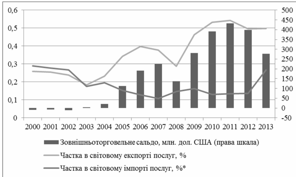
Рис. 5. Показники зовнішньої торгівлі України комунікаційними послугами за 2000–2013 рр.