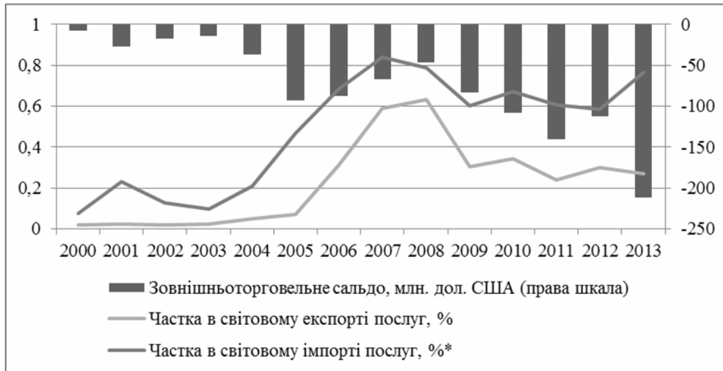
Рис. 9. Показники зовнішньої торгівлі України персональними культурними та рекреаційними послугами за 2000–2013 рр.

Зовнішньоторговельне сальдо культурних та рекреаційних послуг знижувалось протягом всього досліджуваного періоду, найнижче значення було зафіксовано в 2013 році – 0,21 млрд дол.