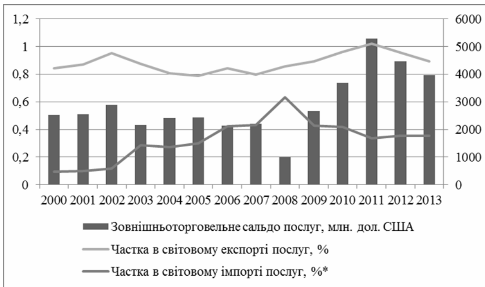
Рис. 1. Показники зовнішньої торгівлі України транспортними послугами за 2000–2013 рр., складено автором за даними (тут і далі джерелом даних про обсяги експорту та імпорту в розрізі груп послуг є база даних Світової організації торгівлі [1])

торгівлі туристичними послугами, надалі, з 2009 простежується тенденція випереджального зростання обсягів імпорту даних послуг (сальдо в 2013 році – -0,68 млрд дол. США).