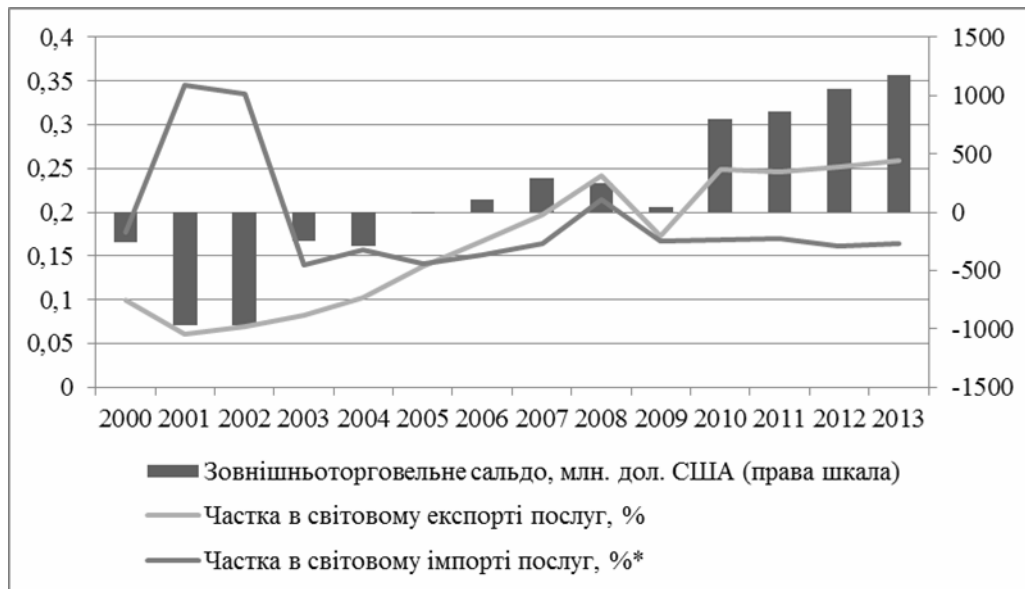
Рис. 3. Показники зовнішньої торгівлі України іншими бізнес-послугами за 2000–2013 рр.

У 2012 році в структурі світового ринку інформаційних технологій 49% витрат припадало на обладнання, 32% – на послуги в сфері ІТ (без урахування телекомунікаційних послуг) і 19% – на розробку програмного забезпечення. Втім, в розрізі національних економік структура ІТ-ринку значно різниться.