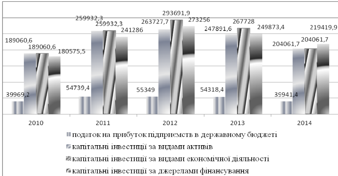
Рис. 2. Залежність податку на прибуток підприємств та капітальних інвестицій за 2010–2014 рр., млн грн. (джерело: розроблено автором на основі даних [11])

державному бюджеті в 2014 році у порівнянні з 2013 роком скоротився на 14 377 млн грн, а у 2010 році – на 27,8 млн грн. Прямі іноземні інвестиції в 2014 році у порівнянні з 2010 роком зросли на 26 867 млн грн.