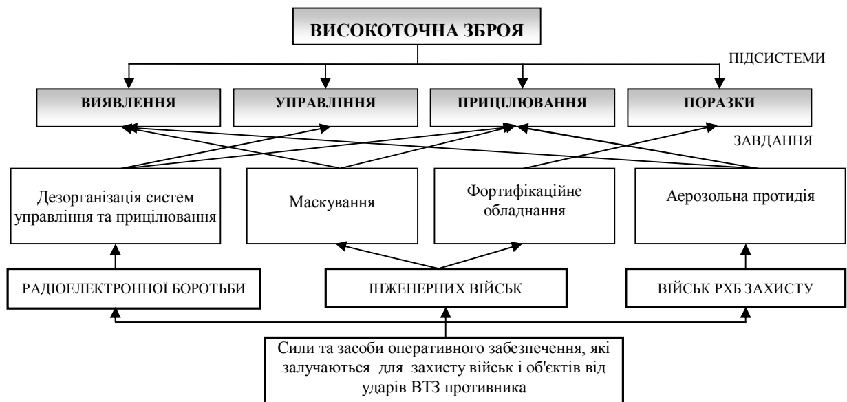
Рис. 1. Завдання, які вирішуються силами та засобами оперативного забезпечення для захисту військ і об'єктів від ударів ВТЗ противника

2. Об'єднання дій на основі єдиної системи управління. Даний напрямок передбачає можливість управління частиною сил виду оперативного забезпечення з метою підвищення узгодженості дій за часом і простором.