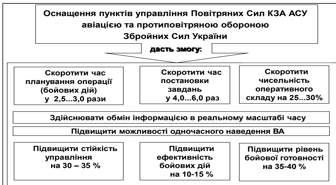
Рис. 1. Рівень зростання показників управління

даними розвідки, безперервного спостереження в глобальному масштабі і розпізнавання кожної цілі, передбачено також нарощування та взаємодія з іншими складовими ЄАСУ. В АСУ авіації та ППО передбачена реалізація фрагментів концепції побудови системи С 4 ISR. При цьому повинен бути забезпечений суттєвий рівень зростання показників якості управління з одночасним зменшенням кількості рівнів управління (рис. 1). Масштабне розгортання такої системи повинно забезпечити отримання найбільшого потенційного ефекту від застосування озброєння ППО.