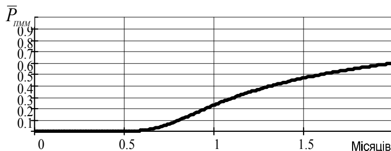
Рис. 2. Ймовірність зриву польотів за відсутністю палива залежно від періодичності його постачання

Як видно, для заданих режиму польотів і технічного стану системи ПММ прийнятний графік постачання палива до авіаційної частини передбачає поставку 60 т палива через кожні 0,5–0,7 місяця або два-три тижні.