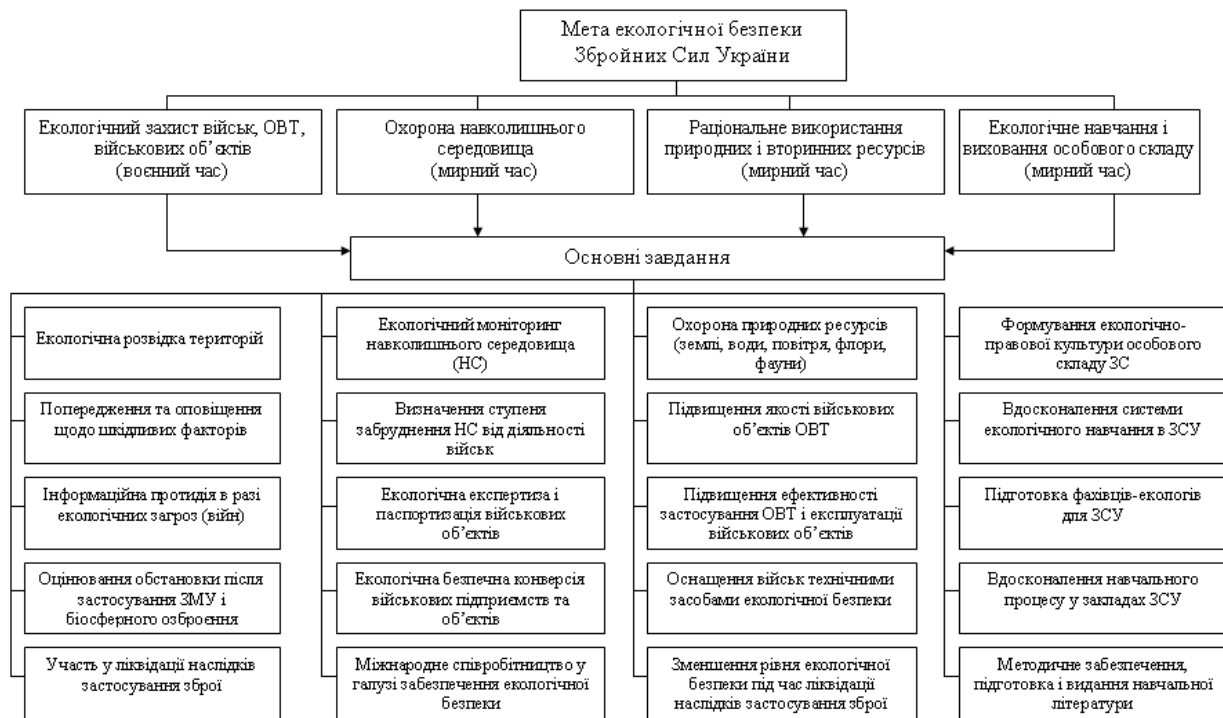
Рис. 1. Мета та основні завдання забезпечення екологічної безпеки ЗС України

посилюванням вимог міжнародних, федеральних, регіональних і місцевих природоохоронних законодавчих та нормативних правових актів;